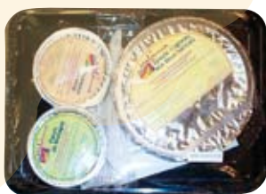
Voorbeeld van een dienblad voor een allergische persoon

In de restaurants die op blz. 5 zijn genoemd worden 2 - 4 verschillende menu's voorgesteld. Deze bestaan uit een voorgerecht, een hoofdgerecht en een dessert. De lijst van gebruikte ingrediënten is zeer uitgebreid (er zijn geen verborgen ingrediënten).